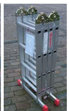
P41 Arbeidsplattform i alu.

Med forbehold om feil i priser og data. Alle prisene er eks. mva. og gjelder 05-03-2010